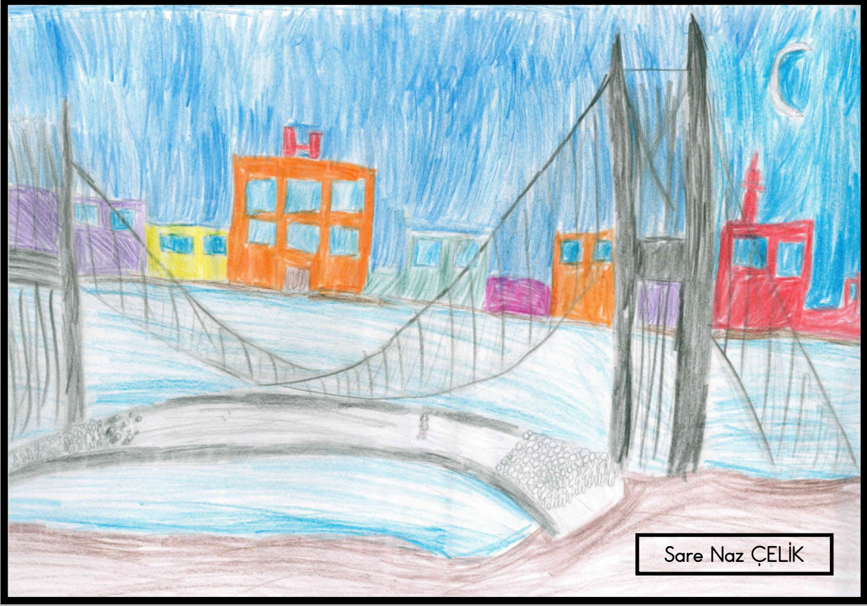
Sare Naz ÇELİK